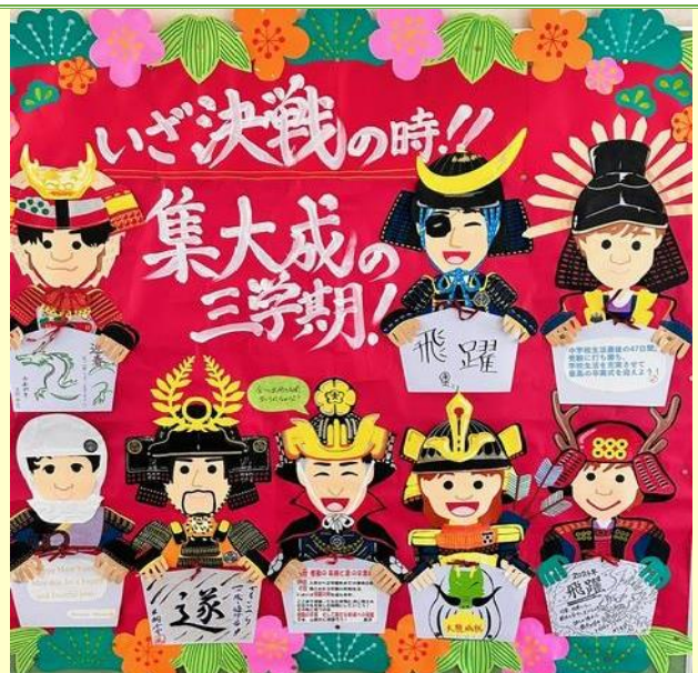
【3年生の廊下に張られた受験に向けた激励のメッセージ】